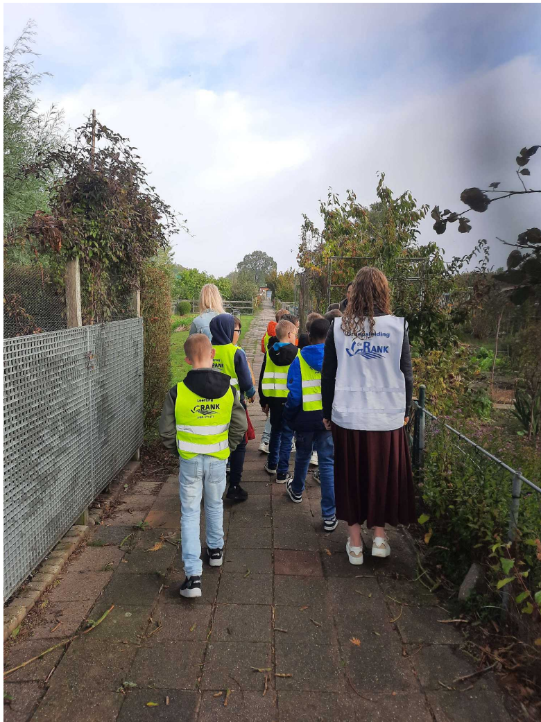
Wandeling over het volkstuinencomplex met kinderen van De Rank uit Barendrecht

Omdat er nog wat tijd over was hebben we een rondje over ons volkstuincomplex gelopen. Enkele leidsters hebben zelf een volkstuin en vonden ons park mooi en groot. Samen met de kinderen hebben we veel groenten benoemt. Opvallend was dat ze er al best veel kenden.